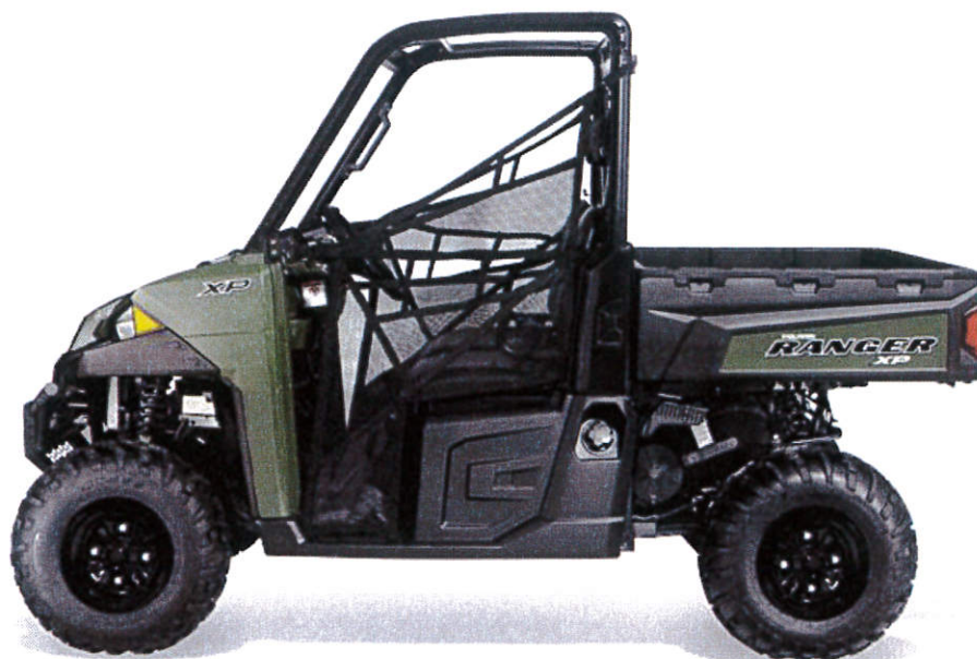
POLARIS RANGER XP 900 EPS